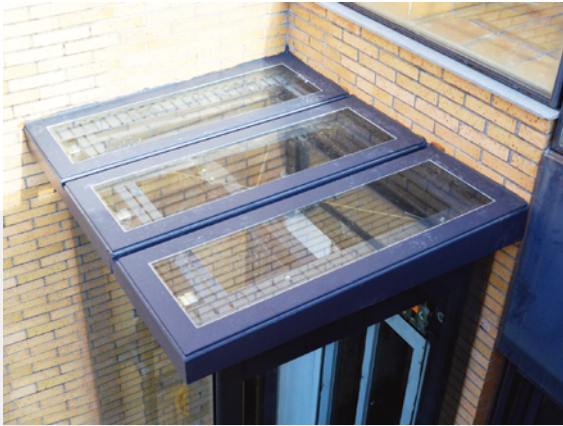
Toit (tôle ou verre)